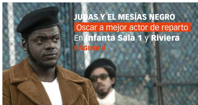
JUDAS Y EL MESÍAS NEGRO Oscar a mejor actor de reparto En Infanta Sala 1 y Riviera PÁGINA 8