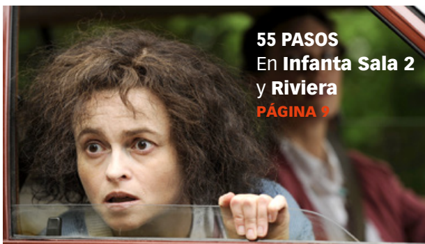
55 PASOS En Infanta Sala 2 y Riviera PÁGINA 9