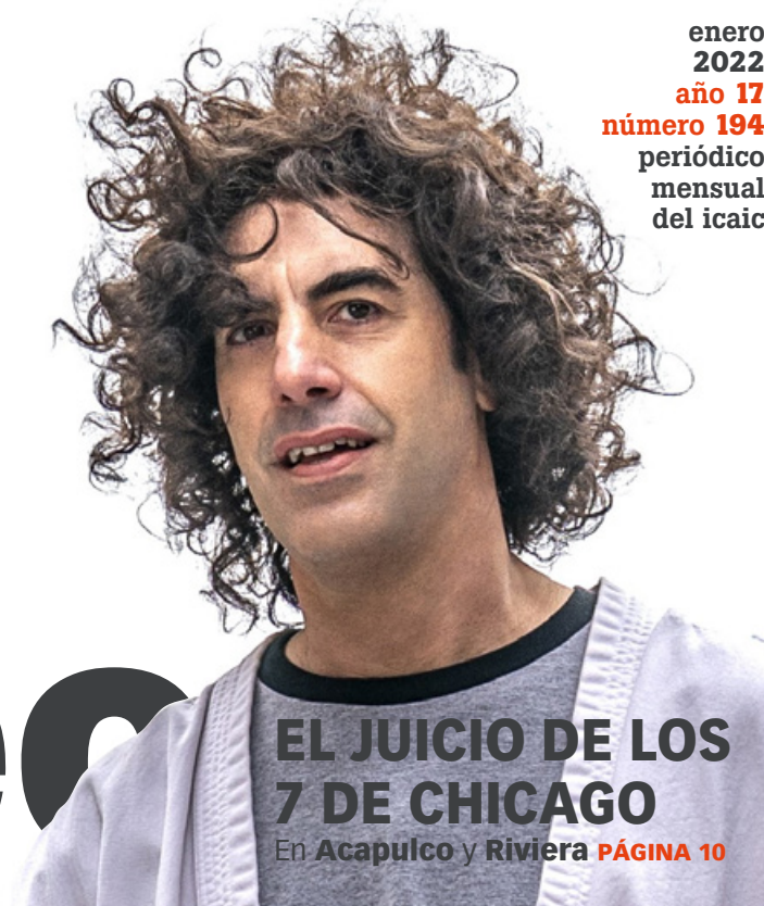
EL JUICIO DE LOS 7 DE CHICAGO En Acapulco y Riviera PÁGINA 10